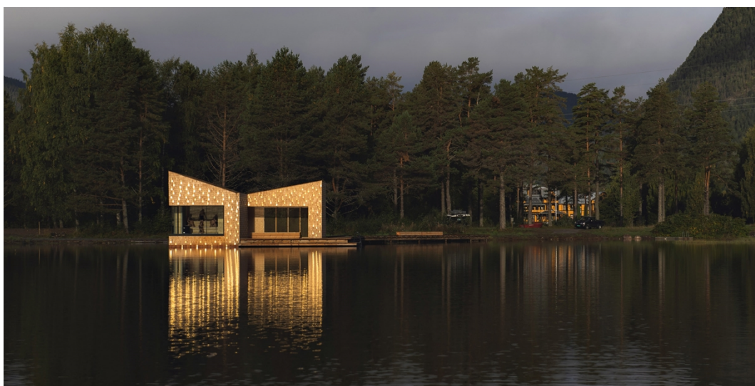
Soria Moria på Dalen