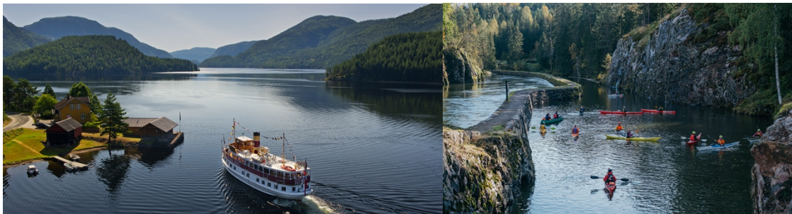
Spjotsodd og Vrangfoss

Aa, kunde eg fara til Telemork og liva ei Sumarstund! Der gror det Ryllik paa Stove-Tak og Songar paa Folkemunn. Til Telemork, dit stend mi Traa til Gauksto-Fjell og til Vinje-Gjeld, til Rjukan sval og til Morgedal. — Til Sumars so fær me sjaa!