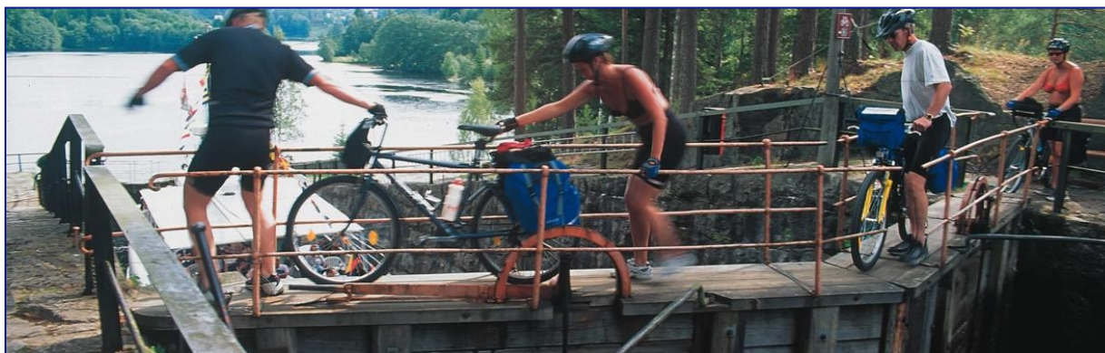
Eidsfoss sluse