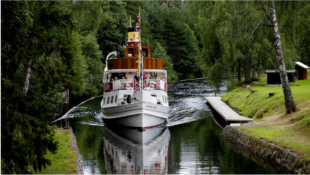
MS Henrik Ibsen, fra Kjeldal til Lunde