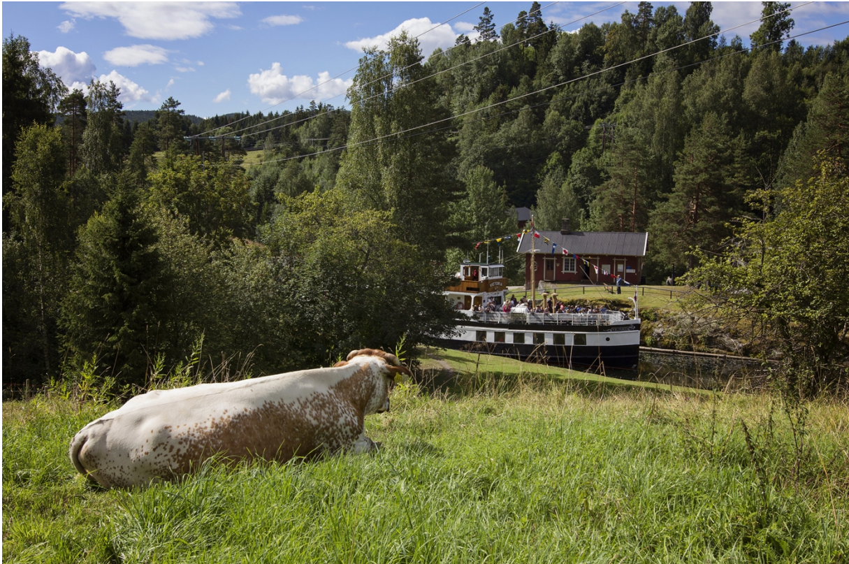
Telemarksku og MS Victoria ved Eidsfoss